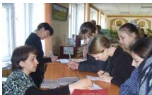
Уютный читальный зал