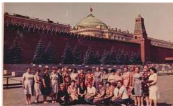
1980 –е годы