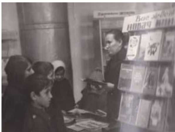
Обзор книг в детской библиотеке

В это время коллектив Детской библиотеки возглавляет опытный, творческий, искренне любящий свое дело человек - Кузнецова Альбина Семеновна, которая внесла огромный вклад в развитие библиотечного дела района, передав свой опыт и знания сельским библиотекарям.